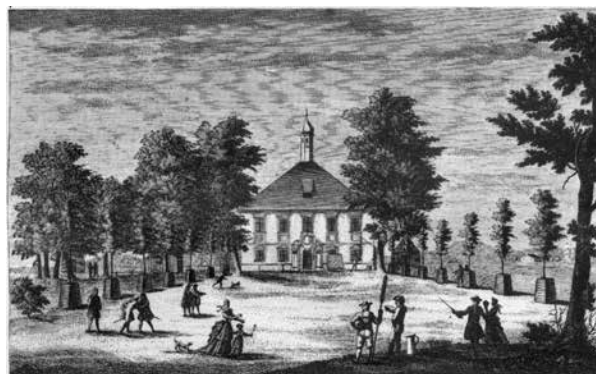
Domus Schützenhaus Straubing. Das Schützenhaus zu Straubing. H. v. W. 1841.